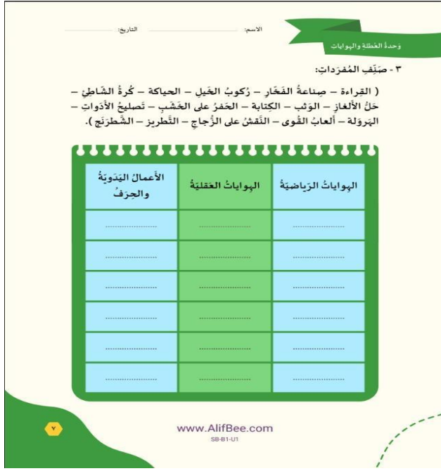
الشكل رقم 1: صورة من كتب التدريبات

ثانيًا: سلسلة القصص والحكايات: يرافق التطبيق سلسلة للقصص والحكايات مؤلفة من ثلاثة مستويات تعليمية (المبتدئ